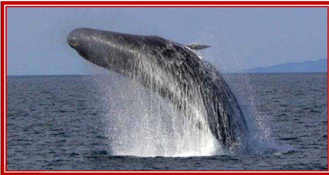
Avistamiento de Cetáceos en Tarifa

Si lo que buscas es salir y volver en el mismo día, sin necesidad de dormir fuera de casa, Acción y eventos te ofrece una variedad de actividades deportivas, culturales y de ocio para tu grupo