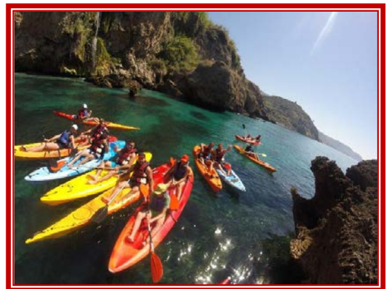
Kayak por Nerja y Maro