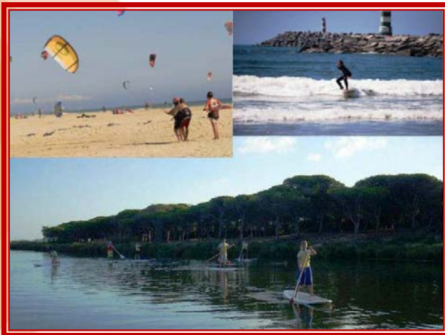
Combinado Surf – Kite – Paddel Sub