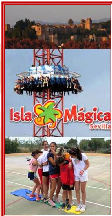
Gymkhanas/Parque de Atracciones/Visitas Monumentos