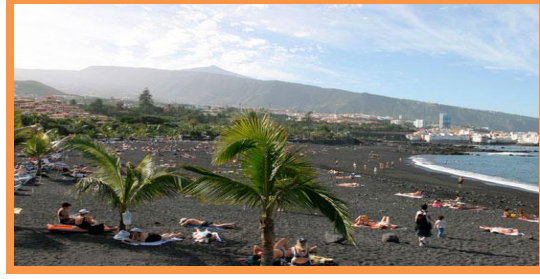
Alojamiento en Hotel Be Live Orotava ****