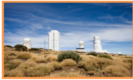
Curso de Surf y Visita al Observatorio Astronómico de Tenerife