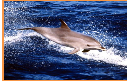
Excursión en Catamarán (Acantilados y Avistamiento de Cetáceos)