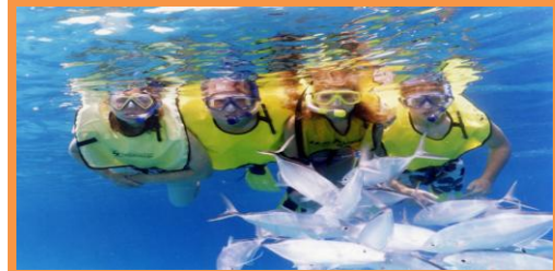
Snorkeling - Estudio del Ecosistema Submarino